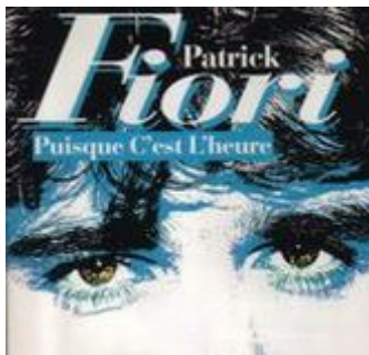
Puisque c'est l'heure