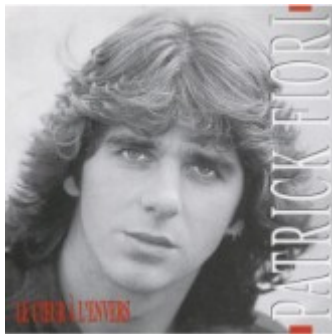
Le coeur à l'envers