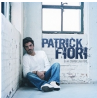
Si on chantait plus fort