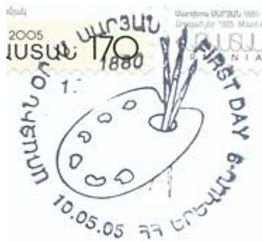
▪ Cachet du premier jour de l'émission.