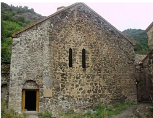
Façade du narthex

Le narthex de la chapelle de l'évêque Grégoire est construit à une période de développement du monastère au XIII e siècle. Il est adjacent à l'ouest à l'ancienne basilique. Le dôme du bâtiment possède une ouverture qui repose sur quatre colonnes au centre de la salle [Quoi?] (un erdik)Le bâtiment a une entrée unique du côté gauche du mur sud. Le bâtiment porte sur son portail la date de sa fondation en 1224 par l'évêque Grégoire 12 .