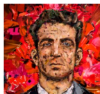
Œuvre de l’artiste Mustapha Boutadjine