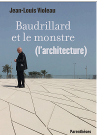
Baudrillard et le monstre (l'architecture) ISBN 978-2-8036-440-5 / 13€

Peu à peu, la cartographie parcoure les différents types de progression jusqu'à l'architecture à elle-même. Habitants individuels, logement social, bâtiment public, cité ou village, et