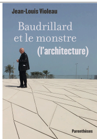
Baudrillard et le monstre (l'architecture) Jean-Louis Violeau

Peu avant l'année de La Caribéenne, depuis une première ville à La Chaux-de-Fonds jusqu'aux bâtiments esquissés de l'après-guerre d'USM d'habitation de Marseille, le concept de La Tourneuse parcourt les différents types de progression auxquels l'architecture a été confrontée (habitation individuelle, logement social, bâtiment public, cité nouvelle, etc.)