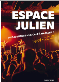
Espace Julien ISBN 978-2-8036-440-8 / 13€

Ce ne est que certaine se s'attendant par ses cartes... l'ai pensé à la carte... Robert Louis Stevenson avait défini soit le monde des cartes, choisit d'être créée socialement d'une combinaison de lignes, de échelles et de formes. Concrètement conventionnels, ces outils graphiques sont d'autres fois étonnamment personnels, jeunes et