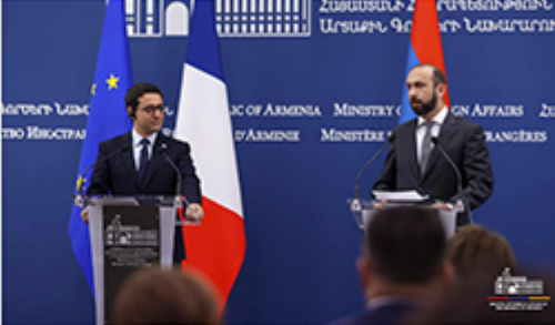
Արարտ Սեմուրն եւ Արարտ Միրզոյան ժխտող ճանկը ատուցեց ընթացքին

Ֆրանսան պիտի շարունակէ պաշտպանութեան բնագաւառին մէջ Հայաստանին աջակցութիւնը: Երբեւեմ մէջ, Հայաստանի արտաքին գործերու նախարար Արարատ Միրզոյանին հետ համառոտ ստույգ ժամանակ այս մասին խոսելու Ֆրանսայի արտաքին գործերու նախարար Սթիֆան Սեմուրին: «Հայաստանը պէտք է կարենայ պաշտպանել իր անբողբալ տարածքները՝ իր սարսափը, իր բնակչութիւնը: Բարեկամներու միջեւ բնական է համագործակցութիւնը նաեւ այս բնագաւառին մէջ, եւ մենք այդ կ'ընենք» եւս մէկ անգամ ինքնիշխանութեան յարցանքով եւ ստանց որեւէ մտազայտութեան կամքով, ընդգծեց սե: «Հայաստանը կ'ուզէ խաղաղութիւն, Ֆրանսան կ'ուզէ խաղաղութիւն, միջազգային հանրութիւնը կ'ուզէ խաղաղութիւն եւ թանկ որ Արարտ Միրզոյանը շատով պիտի հրաբրձայէ COP 29-ը (ԱԿԻԿ Գլխավոր փոփոխութեան մասին