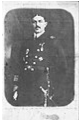
▪ Rauf Orbay