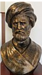
Gazi Hasan Pasha ▪