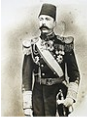
Ali Osman Pasha