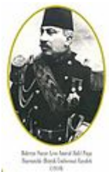
Uniforme naval en 1910