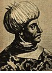
Uluç Ali Paşa