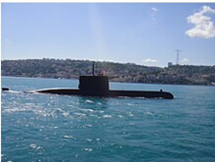
Sous-marin de la marine turque.