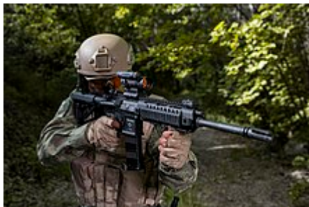
Entraînement d'un soldat turc armé d'un KCR-556