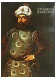
Khayr ad-Din Barberousse