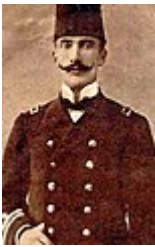
Fuat Hüsnü Kayacan