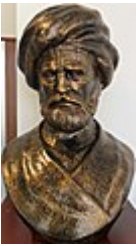
Gazi Hasan Pasha ▪