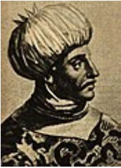
Uluç Ali Paşa