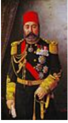
Bozcaadalı Hasan Hüsnü Pasha (1890)