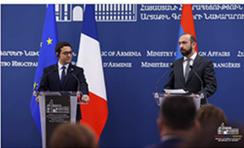
Արթուր Սեմիրյան եւ Արարատ Միրզաչեան ժխտող ճանկը ատուցեց ընթացքին

Ֆրանսան պիտի շարունակէ պաշտպանութեան բնագաւառին մէջ Հայաստանին աջակցութիւնը: Երբեւնայեւ մէջ, Հայաստանի արտաքին գործերու նախարար Արարատ Միրզաչեանի հետ համառոտ ստույգ ժամանակ այս մասին խոսելու Ֆրանսայի արտաքին գործերու նախարար Միշել Բարոնը: «Հայաստանը պէտք է կարենայ պաշտպանել իր անբողջութիւնները»: Իր տարածքը, իր բնակչութիւնը: Բարեկամներու միջեւ բնական է համագործակցութիւնը նաեւ այս բնագաւառին մէջ, եւ մենք այդ կ'ընենք»: Եւ մէկ անգամ ինքնիշխանութեան յարցանքով եւ ստանց որեւէ մտազայտութեան կամքով, ընդգծեց սա: «Հայաստանը կ'ուզէ խաղաղութիւն, Ֆրանսան կ'ուզէ խաղաղութիւն, միջազգային հանրութիւնը կ'ուզէ խաղաղութիւն եւ թանկ որ Արարչընանք շատով պիտի հրաբրձայէ COP 29-ը (ԱՄՆ-ի Գլխավոր փոփոխութեան մասին