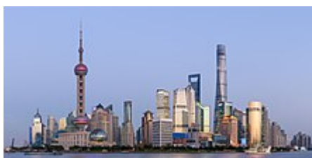
Quartier d'affaires de Lujiazui depuis le Bund.

En 1984, à Anhui , une coentreprise avec le constructeur automobile Volkswagen constitue la première usine automobile construite avec une marque occidentale. Volkswagen Shanghai représente une part de marché d'environ 60 % sur les véhicules étrangers en Chine, ce qui est en baisse constante en raison d'une concurrence accrue. Les droits d'importation élevés sur les voitures étrangères les rendent encore plus chères. Ainsi, après l' adhésion à l'OMC de la république populaire de Chine, la conférence de l' APEC en 2001 a réduit progressivement les droits à l'importation.