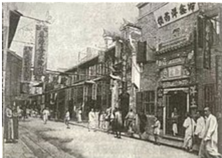
La rue de Nankin à la fin du XIX e siècle