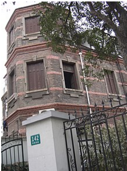
Concession française de Shanghai

Article détaillé : Concessions étrangères en Chine .