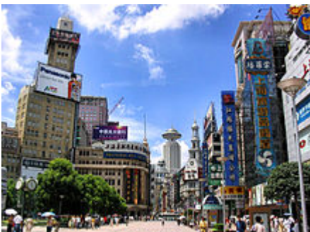
La rue piétonne de Nankin .