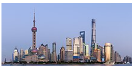
Quartier d'affaires de Lujiazui depuis le Bund.

En 1984, à Anhui , une coentreprise avec le constructeur automobile Volkswagen constitue la première usine automobile construite avec une marque occidentale. Volkswagen Shanghai représente une part de marché d'environ 60 % sur les véhicules étrangers en Chine, ce qui est en baisse constante en raison d'une concurrence accrue. Les droits d'importation élevés sur les voitures étrangères les rendent encore plus chères. Ainsi, après l' adhésion à l'OMC de la république populaire de Chine, la conférence de l' APEC en 2001 a réduit progressivement les droits à l'importation.