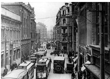
Rue de Shanghai vers 1925

Cependant, ce n'est qu'après les guerres de l'opium et la présence étrangère que le développement économique de la ville a pris l'envergure qui a fait sa réputation. Pendant la première guerre de l'opium , les forces britanniques ont