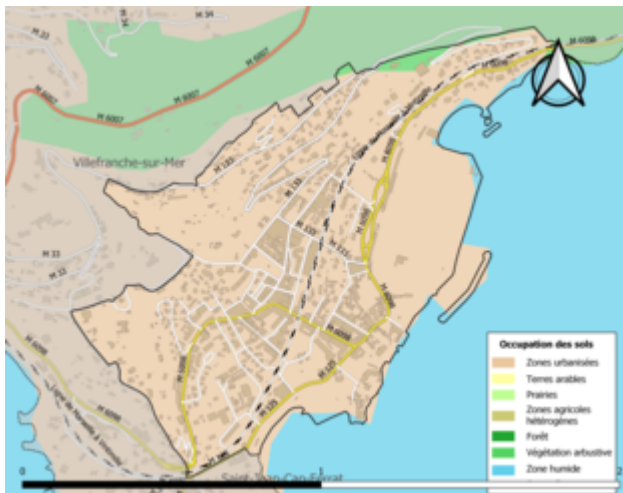
Carte de l'occupation des sols de la commune en 2018 ( CLC ).