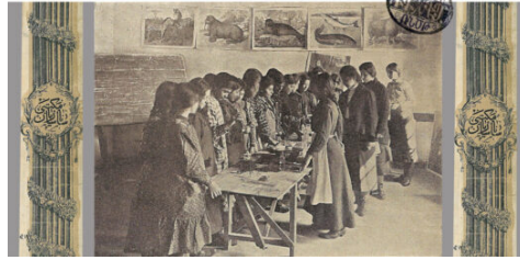
Les écoles arméniennes de Garin/Erzeroum. (3)

L'auteur des trois articles est Robert Tatoyan. Ce dernier article se concentre sur les écoles paroissiales de la ville de Garin/Erzurum : les écoles Ardznian, Hripsimyan, Der Azarian, Msrian, Aghabalian et Kavafian. L'article présente également des détails sur les écoles des villages à population arménienne du sous-district d'Erzurum.