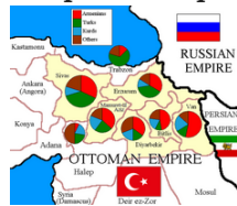
Carte ethnique des six vilayets selon le Patriarcat arménien de Constantinople en 1912.