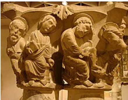
Musée du cloître de Notre-Dame-en-Vaux , Châlons-en-Champagne (Marne), France.

Saint Bernard identifie le lavement des pieds à un des principaux signes que le Christ nous laisse avant sa Passion. Il en parle comme d'un sacrement, au sens antique d'un "secret sacré". « De même, lorsque le Seigneur vit que sa passion approchait, il eut soin d'investir ses disciples de sa force, afin que la grâce invisible fût communiquée par un signe sensible. Voilà pourquoi tous les sacrements ont été institués : telle est la communion eucharistique, telle l'ablution des pieds, tel enfin le baptême lui-même, le premier des sacrements, celui dans lequel nous sommes entrés en Jésus-Christ par la ressemblance de sa mort 7 . »