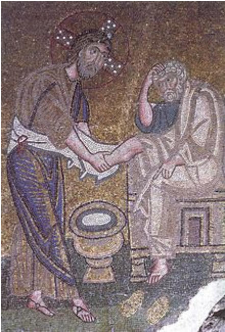
Mosaïque du monastère Nea Moni de Chios (xi e siècle).