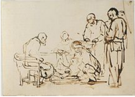
Le lavement des pieds, Rembrandt , Rijksmuseum, Amsterdam .