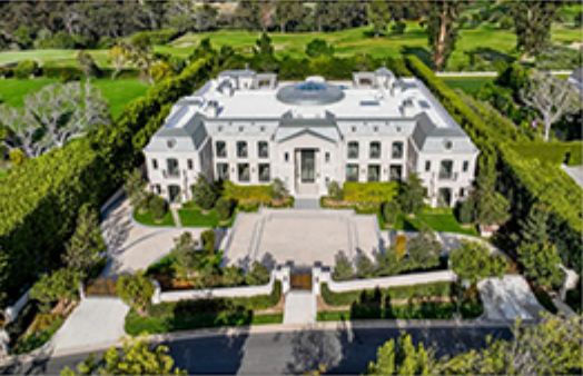
Բռնագրաւման ենթակայ Խաչատրեաններու շքեղ ապարանը Լուս Աճծելիսի մէջ

Միացեալ Նահանգներու դատարանին որոշմամբ՝ Պետական Եկամտաւերելու Կոմիտէի նախկին նախագահ Գաղիկ Խաչատրեանի ընտանիքին պատկանող Լուս Աճծելիսի մէջ գտնուող ապարանը պիտի բռնագրանմուխ եւ աննարարք շուկայական արժէքով վաճառուի: Այդ մասին յայտնած է Հայաստանի Գլխաւոր Դատախազութիւնը: