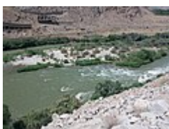
L'Araxe au poste frontière de Nurduz