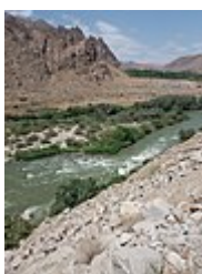
L'Araxe au poste frontière de Nurduz