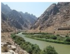
L'Araxe au poste frontière de Nurduz