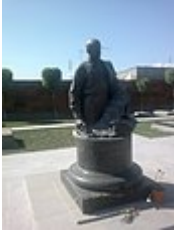
■ Tombeau de Komitas