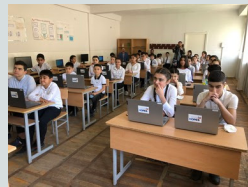
Caption: Students at Kapan, School N1 in the Syunik Marz