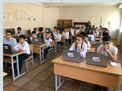
Légende : Etudiants de Kapan, école N1 dans le Syunik Marz