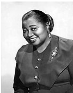
Hattie McDaniel (Mamma).