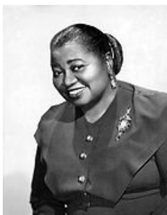
Hattie McDaniel (Mamma).