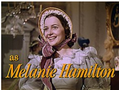
Olivia de Havilland.