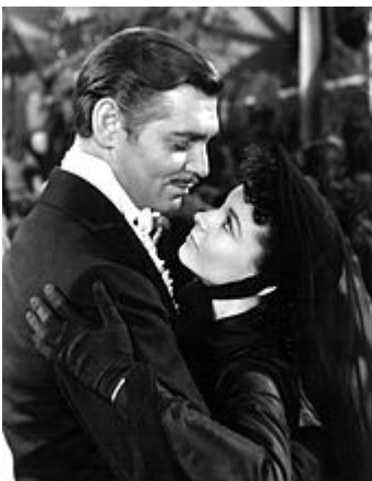
Rhett Butler (Clark Gable) enlaçant Scarlett.

Une fois installée à Atlanta, Scarlett se met au commerce du bois (une activité florissante alors, liée à la reconstruction du pays) et fait même revenir en ville Melanie et Ashley pour qu'ils s'associent à son affaire ; Scarlett n'hésite d'ailleurs pas à se servir de prisonniers de guerre pour développer son activité. Les affaires de Scarlett prospèrent, la jeune femme maintenant sa domination sur son mari qui la craint. Mais, un jour, Scarlett est agressée par des maraudeurs noirs alors qu'elle se rendait seule à l'une de ses scieries ; elle est cependant sauvée par son ancien esclave de Tara, Big Sam. À la suite de l'agression, son mari, accompagné d'anciens confédérés (liés au Ku Klux Klan ) effectuent une expédition punitive de nuit et tuent plusieurs noirs, mais son mari trouve la mort. D'autres participants (comme Ashley et le docteur Meade) ne doivent leur salut qu'à Rhett Butler quand des soldats unionistes viennent les arrêter, Rhett (étant connu des unionistes grâce à ses trafics) intervenant en leur faveur en leur fournissant un alibi.