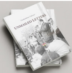
Unmailed Letters BUY >