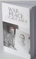
War and Peace in the Caucasus: Ethnic Conflict and the New Geopolitics BUY >