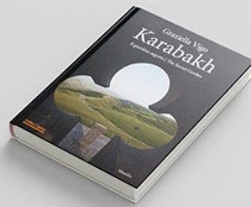
Karabakh: Il giardino segreto / The Secret Garden BUY >