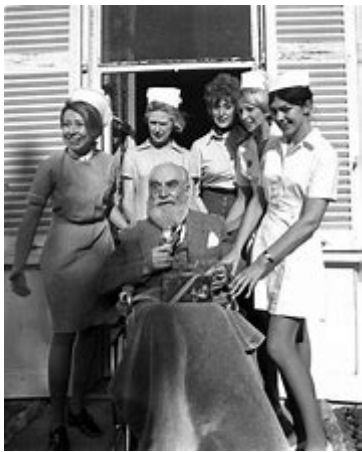
Noubar (fils de Calouste) Gulbenkian