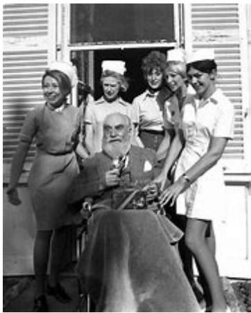
Noubar (fils de Calouste) Gulbenkian