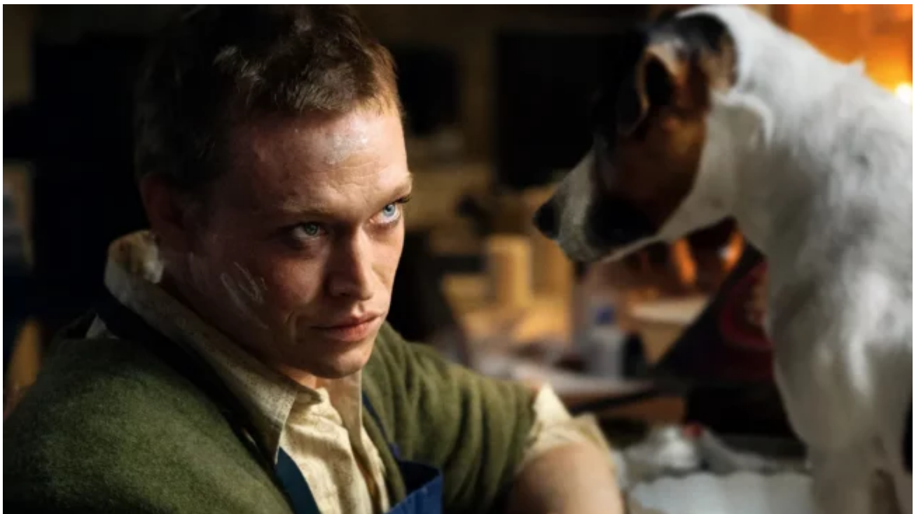
Dogman de Luc Besson

Autres deux réalisateurs ont représenté donc la France lors de cette 80e édition du plus ancien festival du monde, Luc Besson, Bertrand Bonello, ont porté les couleurs de la France, cette année très riche en cinéma français.