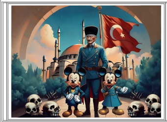
Atatürk rejoindra la famille Disney