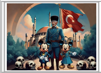
Atatürk rejoindra la famille Disney