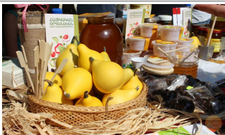
Fête de la moisson

Vous avez toujours voulu tout laisser tomber et déménager dans un village en Arménie et vivre une vie simple ? Nous connaissons ce sentiment, et ce festival est votre chance d'avoir un avant-goût de ce que cela pourrait être. Avec des démonstrations directes de différents aspects de la vie du village, de la cuisine à l'artisanat, en passant par les chants et danses traditionnels, c'est l'un des plus anciens festivals annuels en cours d'Arménie qui pourrait bien vous convaincre de faire ce grand pas auquel vous avez toujours pensé.