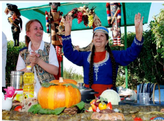
Fête de la citrouille

Ah, gata. Doux, doux gata. Si vous n'avez pas eu ces petits pains traditionnellement farcis au sucre et au beurre, alors ce festival est fait pour vous. Gata Fest a lieu chaque année dans le village frontalier de Khachik, raison de plus pour en faire l'expérience ! Vous pourrez non seulement voir bourrer le visage avec de nombreux types de gata différents, du traditionnel à l'expérimental, mais vous soutiendrez également l'économie locale de ce village.