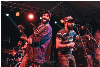
Festival international de musique de Sevan

L'Arménie a une tradition millénaire d'art tissé et de fabrication de textiles, qui comprend des vêtements et des vêtements traditionnels appelés taraz. Vous avez sans aucun doute été émerveillé par les couleurs éblouissantes et les motifs complexes des vêtements arméniens d'autrefois. Alors que la plupart des gens en Arménie ne portent plus de taraz, ce festival est une excellente occasion d'apprécier de près et de manière personnelle les versions traditionnelles et contemporaines du taraz.