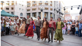
Fête de Taraz (tenue traditionnelle)

FOMA : Peur de manquer l'Arménie. C'est peut-être quelque chose que vous avez vécu dans le passé, ou que vous vivez en ce moment. Il n'y a vraiment qu'un seul remède : réservez ce vol et ce séjour dans ce B&B local dont vous rêviez, et tuez FOMA dans l'œuf ! Pour vous aider à découvrir le meilleur de l'Arménie cet été, nous partageons différentes listes de seaux, et cette semaine, tout est question d'art et de culture. Résumer des milliers d'années de culture dans une liste de choses à faire s'est avéré plus difficile que prévu. Mais grâce aux gens de FestivAr , une association locale de festivals culturels, vous pouvez découvrir l'art et la culture arméniens à travers plusieurs festivals à venir. Découvrez-les ci-dessous et rendez-vous sur la page de FestivAr pour en savoir plus et planifier votre voyage culturel dès maintenant !