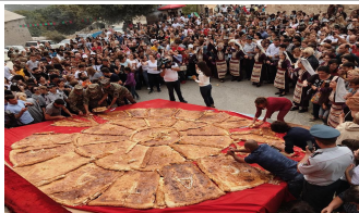
Fête de Gata

L'Arménie abrite des centaines d'herbes sauvages comestibles différentes qui poussent naturellement à travers la campagne, ainsi que sur les trottoirs d'Erevan ! C'est grâce à la situation géographique du pays et à la diversité des altitudes. Lors du festival annuel des récoltes, vous en apprendrez un peu plus sur ces herbes, ainsi que sur les délicieux fruits et légumes que fournit le sol fertile de l'Arménie, auxquels vous pensez sans aucun doute à chaque fois que FOMA entre en jeu.