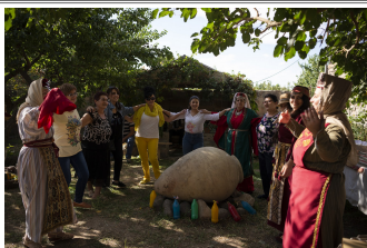
1000 ans de vie villageoise

Ce qui a commencé comme un festival de musique local organisé par un club de jeunes à Sevan en 2015 est devenu un événement international annuel qui attire des artistes musicaux du monde entier, dont la France, les États-Unis, la Russie et la Géorgie. L'accent de ce festival de musique est le rock (au sens le plus large du genre) et la musique folklorique contemporaine. Emballez votre équipement de plage, réservez votre hébergement et dirigez-vous vers la côte de Sevan pour vous amuser cet été !