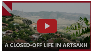
PHOTO DE LA SEMAINE

La population d'Artsakh est soumise à un blocus depuis plus de six mois maintenant. La fermeture par l'Azerbaïdjan du corridor de Lachin a laissé la région sans accès à l'Arménie ni au reste du monde. L'équipe de CivilNet sur le terrain continue de visiter différents villages d'Artsakh pour comprendre de première main comment les gens font face au jour le jour.