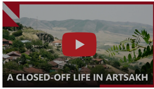
PHOTO DE LA SEMAINE

La population d'Artsakh est soumise à un blocus depuis plus de six mois maintenant. La fermeture par l'Azerbaïdjan du corridor de Lachin a laissé la région sans accès à l'Arménie ni au reste du monde. L'équipe de CivilNet sur le terrain continue de visiter différents villages d'Artsakh pour comprendre de première main comment les gens font face au jour le jour.