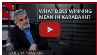
PHOTO DE LA SEMAINE