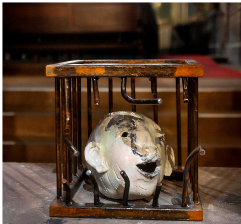
Le cri de la liberté: céramique de Francine Mayran dans une cage créée par les élèves de CAP métallier du lycée Heinrich Nessel