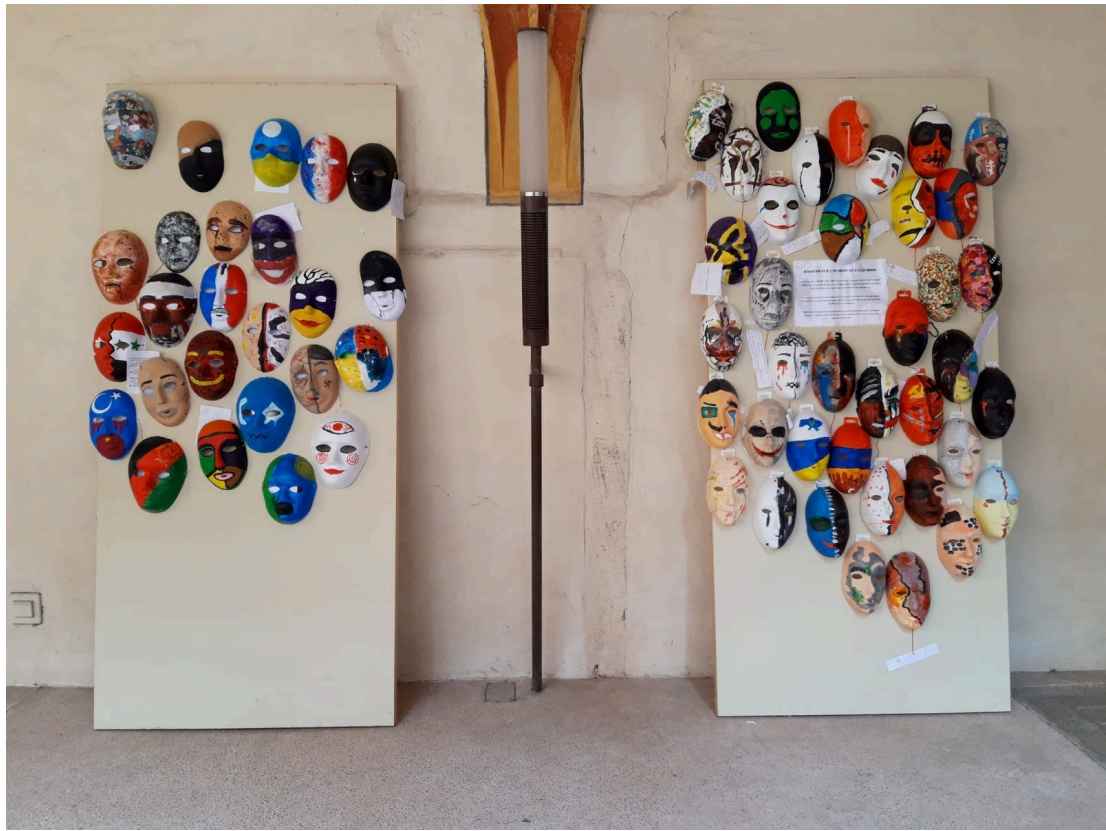
Masques créés par des scolaires sur l'humain et l'inhumain