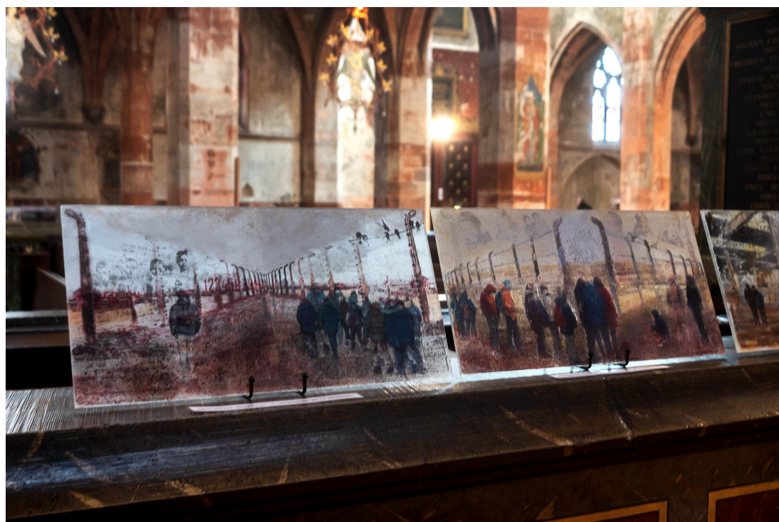
Auschwitz: Œuvres sur plexiglas.