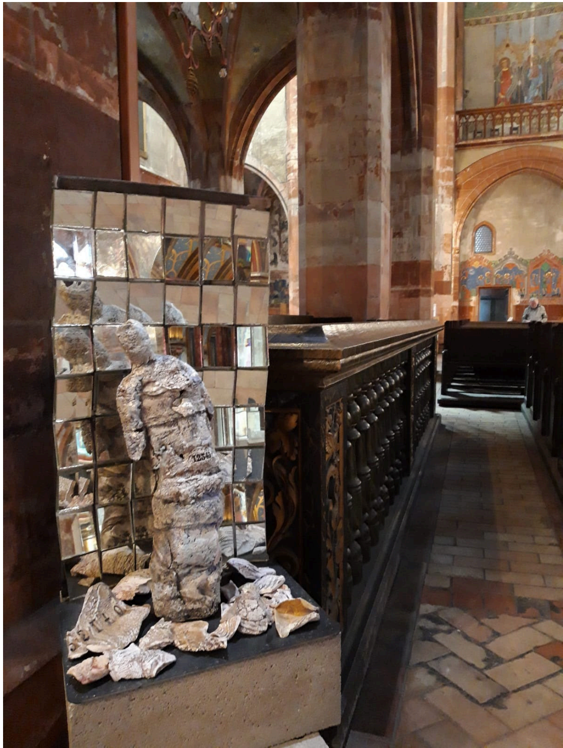
Survivant en céramique sur un socle (métal et miroir) créé par les élèves de 1ère année CAP métallier du lycée Heinrich Nessel