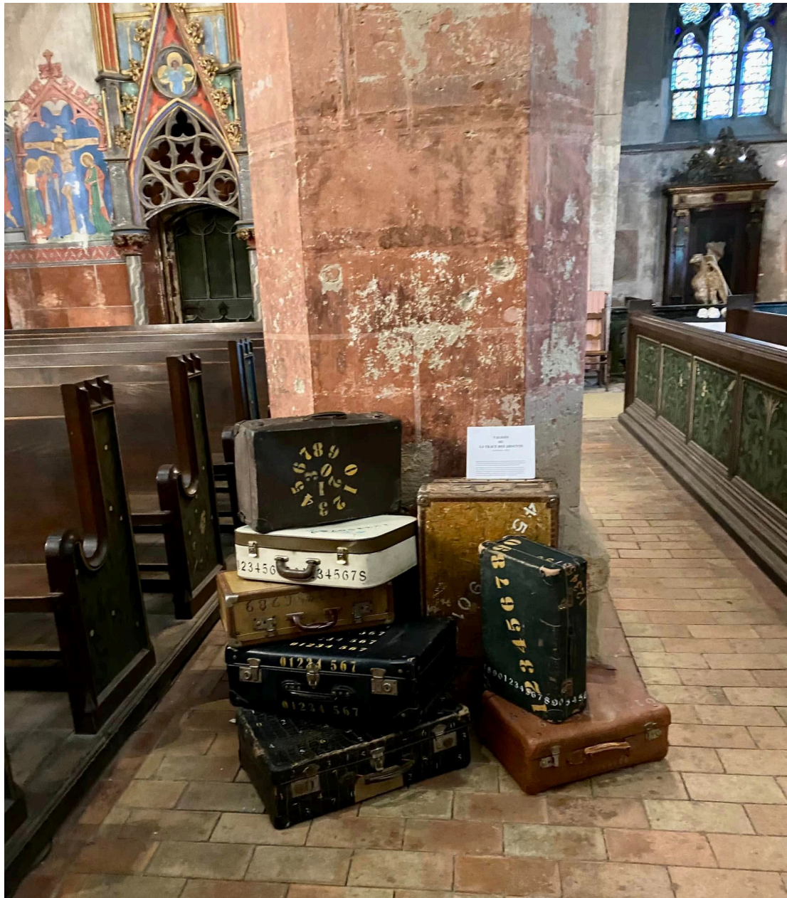
La trace des absents