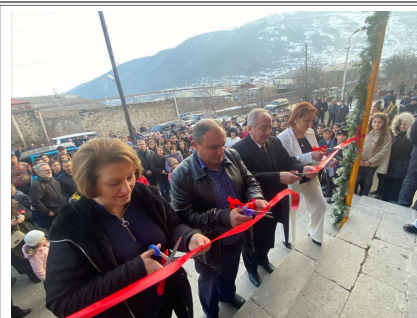
Le gala d'inauguration a été célébré dans toute la communauté de Verishen.

Lors des attaques de septembre 2022 contre l'Arménie par l'Azerbaïdjan, le village de Verishen, qui est adjacent à Goris, comptait quatre maisons dans le village de 2 200 personnes touchées par des attaques au mortier, dont une maison presque adjacente au jardin d'enfants. Même si Verishen partage une frontière avec l'Azerbaïdjan, cette communauté est inébranlable dans son engagement à vivre dans ce village et a dépassé son jardin d'enfants avec 90 enfants. Maintenant, après son agrandissement et sa rénovation, plus de 150 enfants de Verishen et d'autres communautés voisines pourront y assister.