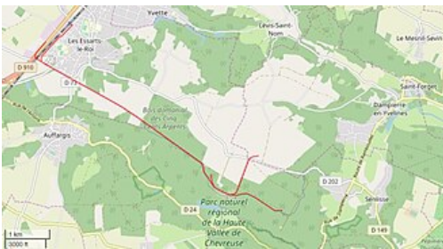
Tracé de la ligne.