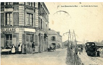
Locomotive devant le Café de la Gare.