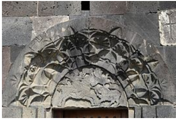
Tympan, façade occidentale de Sourp Nshan .

Directement adossé au nord de l'église, le bâtiment, qui est probablement la chapelle Sourp Nshan (« Saint-Signe », attestée en 13071 , à moins qu'il ne s'agisse d'un oratoire érigé en 1335 ), est une mononef à voûte en berceau et à doubleau surmontée d'un toit en bâtière 9 . Son entrée occidentale est encadrée d'un chambranle orné de stalactites 9 et surmonté d'un tympan représentant un thème laïque, une scène de chasse idéalisée 10 d'inspiration sassanide 2 .