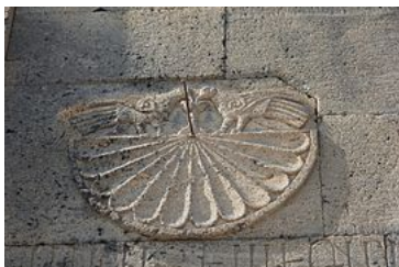
Cadran solaire, façade méridionale de Sourp Stepannos .