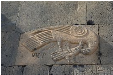
Faucon attaquant une colombe, façade méridionale de Sourp Stepannos .

L'église principale du site, Sourp Stepannos (« Saint-Étienne »), est érigée en 1273-1279 ; il s'agit d'une croix inscrite cloisonnée fermée presque carrée, à chambres orientales à deux étages, et surmontée d'un tambour cylindrique à l'intérieur, dodécagonal à l'extérieur et coiffé d'un cône en ombrelle 1 . Si l'intérieur est faiblement décoré (contour de la porte et des fenêtres), il en va différemment de l'extérieur qui, à côté des paires de niches qui percent les façades septentrionale, orientale et méridionale, se distingue par son riche décor animalier : on retrouve sur la façade méridionale un faucon attaquant une colombe 8 , ainsi que deux autres colombes s'abreuvant à une coupe au-dessus d'un cadran solaire ; quant au tambour, il est orné d'un lion attaquant un bœuf (emblème des Orbélian ) et d'un aigle saisissant un bélier (emblème des Prochian) 7 , d'une tête de bœuf et d'une tête de lion, ainsi que de deux oiseaux 1 .