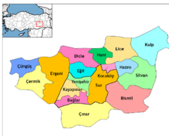
Districts de la province de Diyarbakır