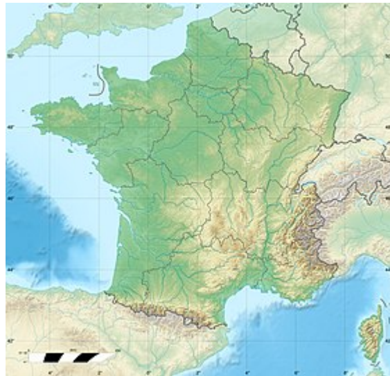
• Le Tignet