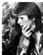
David Bowie is... Back @ La Galerie Stardust