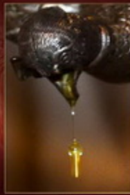
Տեսք՝ ՔՊ. Մարտիկ 2015 Փորձ՝ Խոսիկ Տարցյան