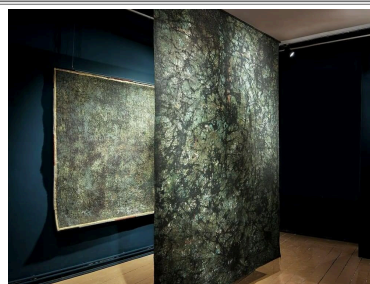
Hrachya Vardanyan, Crack{s} , installation, 2022

En parallèle de la Biennale de Venise, Hrachya Vardanyan présente son installation dans l'exposition collective Personal Structures , au Palazzo Mora de Venise, jusqu'au 27 novembre.