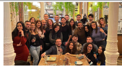
Afterwork des YP Madrid, février 2022