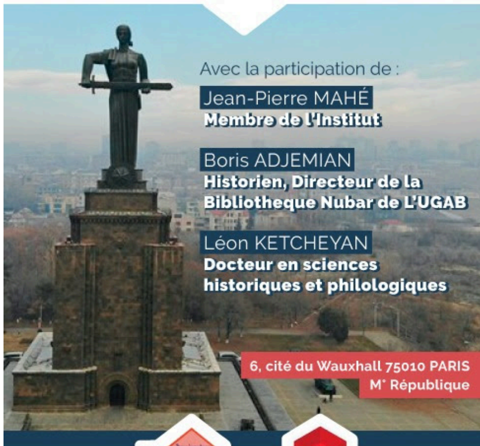
TABLE RONDE EXCEPTIONNELLE : L'ARMÉNIE DANS LA SECONDE GUERRE MONDIALE

Dans le cadre du 78ème anniversaire de l'exécution de Missak Manouchian et de ses compagnons