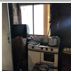
Avant le début de la reconstruction