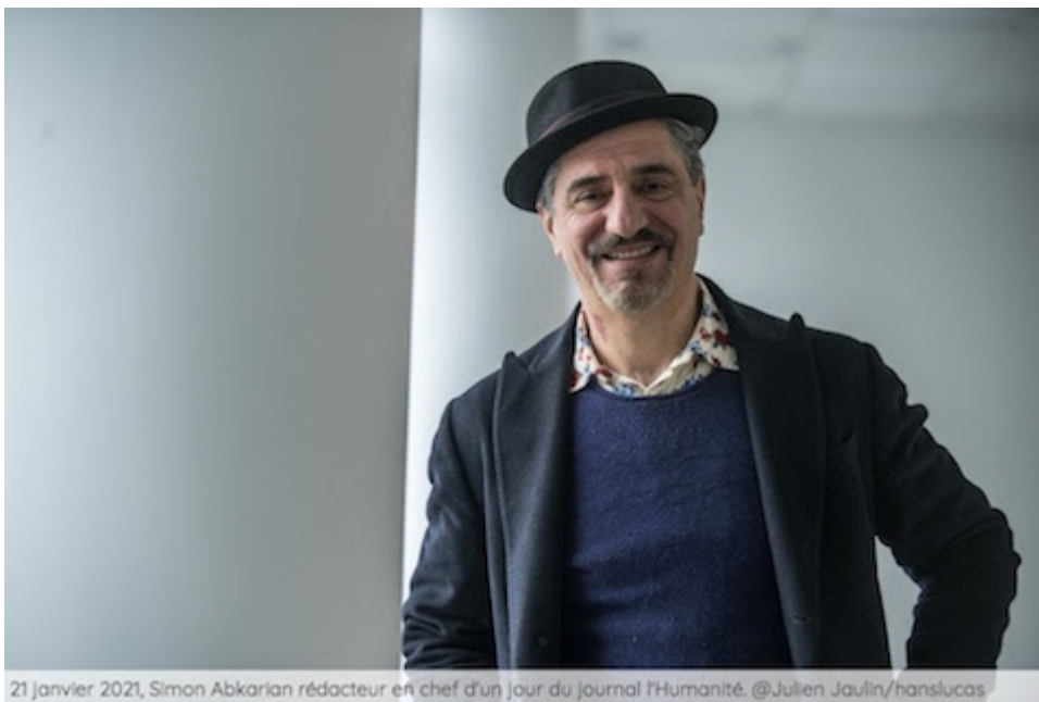
21 janvier 2021, Simon Abkarian rédacteur en chef d'un jour du journal l'Humanité.

https://www.humanite.fr/leditorial-de-simon-abkarian--redacteur-en-chef-dun-jour-de-lhumanite-ma-mere-le-theatre-lartsakh-et