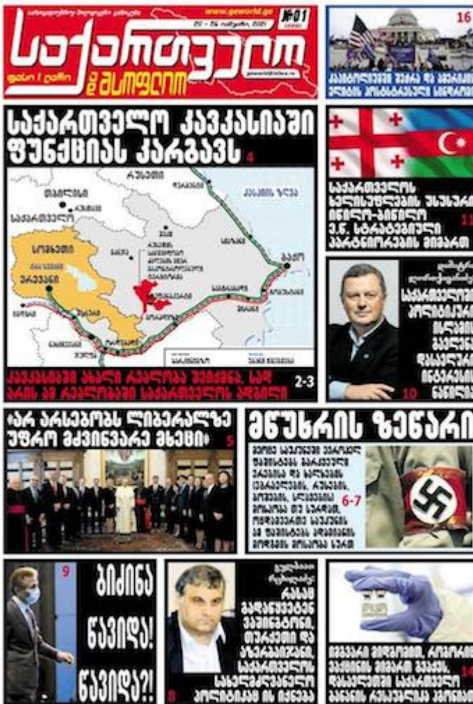
La une de l'hebdomadaire géorgien Sakartvelo da Msplio du 20 au 26 janvier 2021

Les décisions prises lors du dernier sommet tripartite entre la Russie, l'Arménie et l'Azerbaïdjan concernant le déblocage des voies de communication dans la