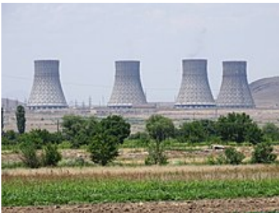
Centrale nucléaire de Metsamor

Metsamor est un centre majeur de l'énergie en Arménie. L'économie de la ville est uniquement basée sur l'exploitation de la centrale nucléaire de Metsamor , [6] fournissant