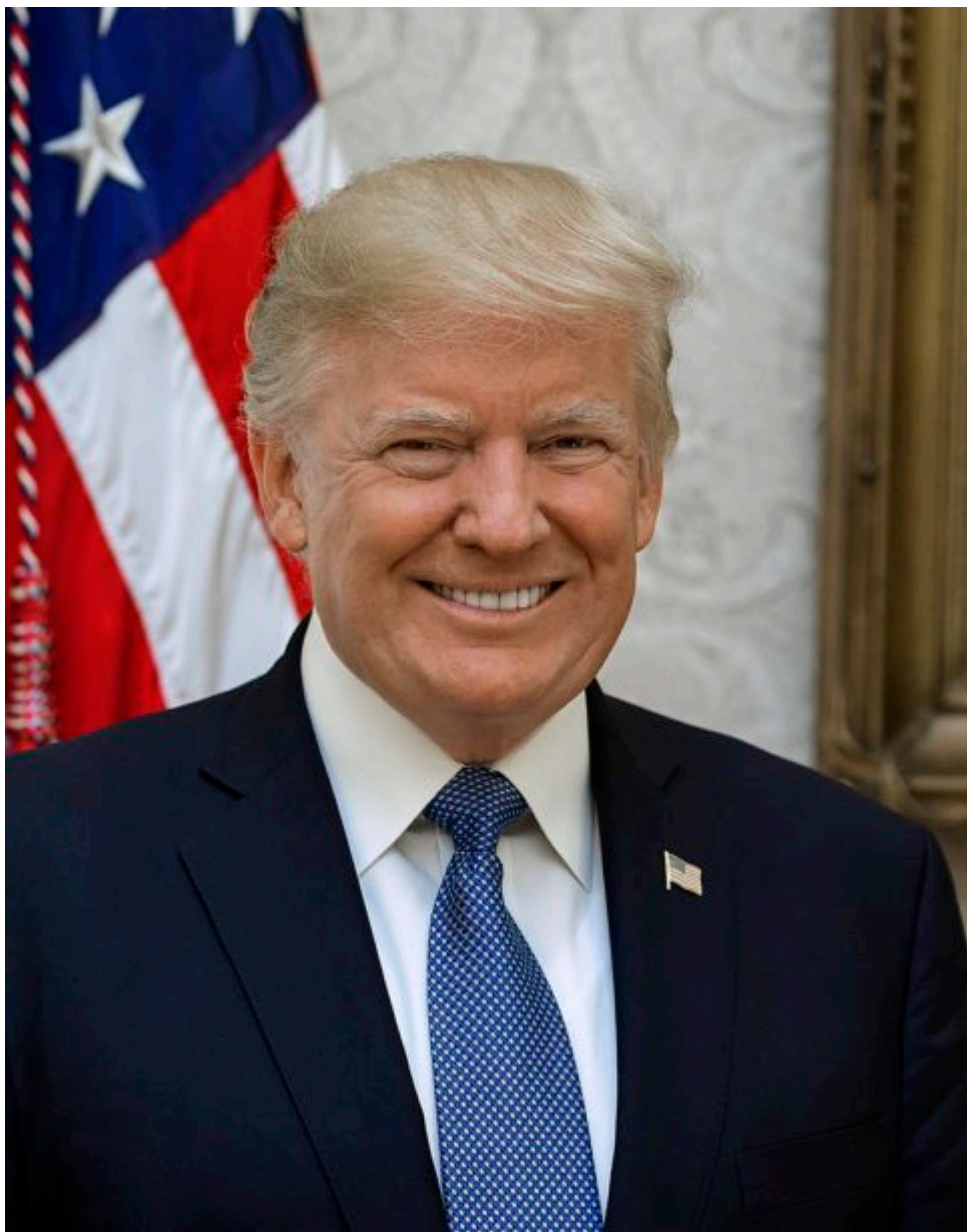
Official portrait of President Donald J. Trump, Friday, October 6, 2017. (Official White House photo by Shealah Craighead)/ domaine public