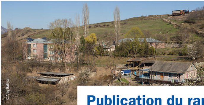
Le village de Voskepar et son école équipée de panneaux photovoltaïques.