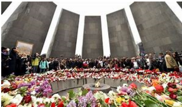
Photo : mémorial du génocide en Arménie .

L'édifice de la première Assemblée Nationale Turque (1920) était situé sur le terrain du cimetière arménien d'Ankara.