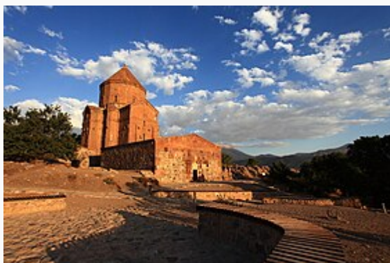
Sourp Khatch (à gauche) et son gavit (à droite) au toit moderne.