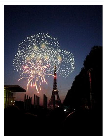
Feu d'artifice du 14 juillet 2006 devant la tour Eiffel .