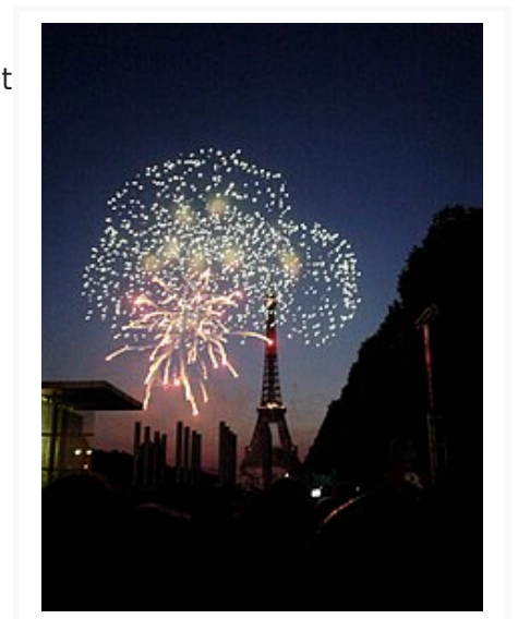
Feu d'artifice du 14 juillet 2006 devant la tour Eiffel .