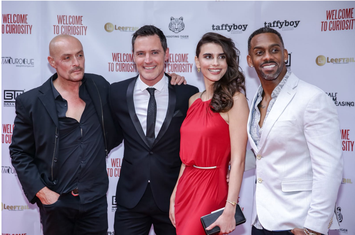
Equipe du film "Welcome to Curiosity"

- L'une des choses intéressantes à l'égard de votre personnage est son côté infâme. Pour vous, quels sont éventuellement les défis de jouer un personnage comme celui-ci ?