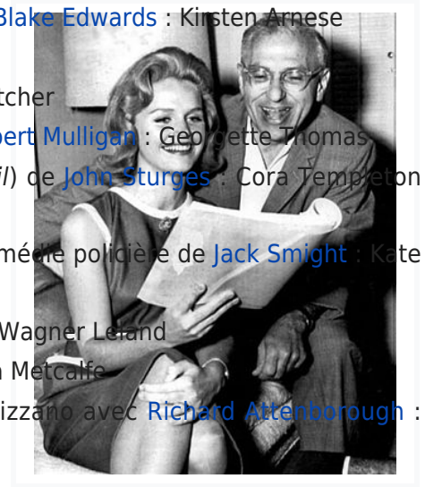
Lee Remick et George Cukor en 1962