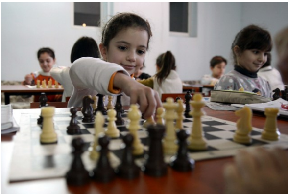
Al Jazeera : Chess Mania capte l'Attention de l'Arménie March 25, 2013