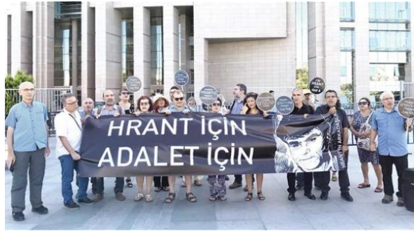
Cour turque libère quatre Suspects dans une affaire de meurtre de Hrant Dink August 5, 2017