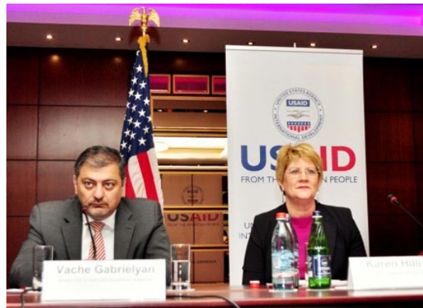
L'USAID défend Support pour disque d'anti- corruption arménienne August 10, 2015