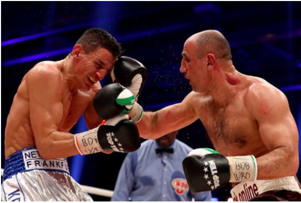
Arthur Abraham bat Robin Krasniqi par décision unanime 23 avril 2017