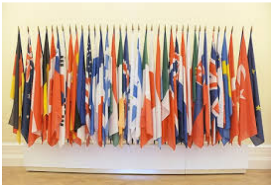
Organisation de coopération et de développement économiques