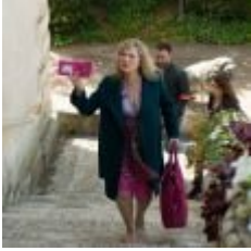
Cécile Bois, Gaya Verneuil, Raphaël Lenglet dans la série Candice