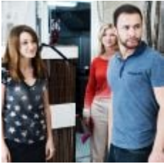
Cécile Bois, Gaya Verneuil, Raphaël Lenglet dans la série Candice Renoir