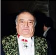
Henri Verneuil à l'Académie des Beaux Arts, Paris, janvier 2000.