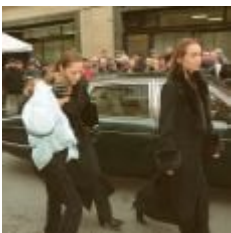
Gaya Verneuil avec sa mère aux obsèques d'Henri Verneuil à Paris janvier 2002.