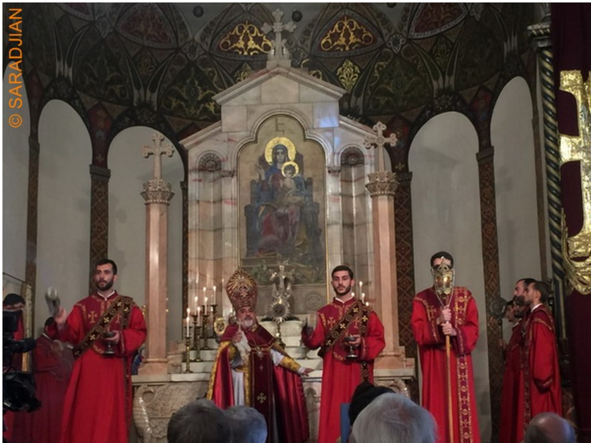
Monseigneur Vahan Hovhanessian lors de la célébration de la Sainte Croix à Etchmiadzine

Ce dimanche 11 septembre 2016, l'Église Apostolique Arménienne a