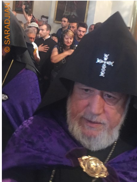
Karekin II, Catholicos de tous les Arméniens