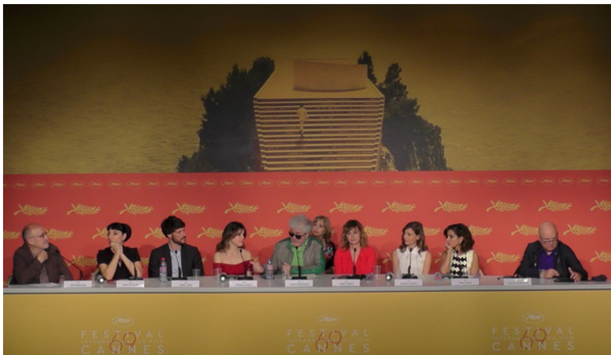
Conférence de presse avec l'Équipe du film - Julieta

connaissance puis il y a eu la mort soudaine de son compagnon, amoureux, lors d'une sortie de pêche en mer. Dans ce long-montrage, on y trouve des décors fabuleux avec des personnages très réalistes.